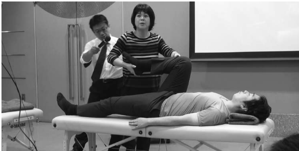
AZPの施術後：膝を曲げる角度が明らかに深くなっており、屈曲制限が改善されたことが見て取れる。

次の手順でAZP理論に基づき施術した。①施術者は患者の足元に位置を取る、②患者をAZPの肢位（姿勢）にする（4ページ〜部分参照）、③この状態で、足関節を把持して（しっかり持つ）踵方向に5回軽く引っ張る。文字にすると長いですが、実際にこれだけの施術にかかった時間は、たったの数秒である。