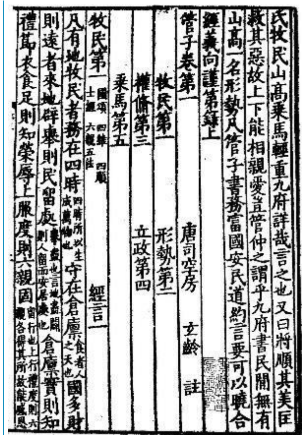
『管子』（四部叢刊初編）

ば則ちその根を失う。四時（＝春夏秋冬）の度（＝規律）に順わざれば則ち民は疾む」（『経法』）